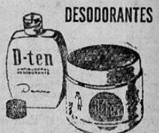
REGULA LA TRANSPIRACION DE LAS AXILAS Y LAS DESODORIZA POR VARIOS DIAS

Las lectoras de "MARISOL" que deseen una información personal, pueden escribir particularmente, describiéndonos su cutis, sin omitir detalles, pero con la mayor concisión posible, para poder contestar a todas, ya que son numerosísimas las cartas que recibo, y con sumo gusto las informaré directamente del tratamiento que deben seguir, y las de Madrid podéis pasaros por mi Instituto de Belleza y gratuita mente y sin compromiso alguno examinaré vuestro cutis y os acon sejaré lo más eficaz.